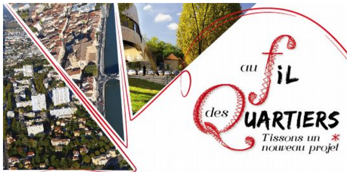
Table de quartier sur la mobilité de 9h30 à 11h15 , Maison citoyenne Noël Guichard

11h45 : départ de la Maison citoyenne pour rejoindre le cours Jean Jaurés à pied, en bus, en vélo